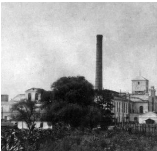
Шебекинский сахарный завод. 1910-е гг.

В истории любого края есть имена, неразрывно связанные с его становлением и развитием, во многом определившие то, каким этот край мы видим сегодня.